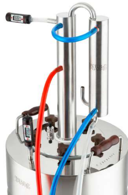
Рис. 3. Подключение аппарата в режиме укрепления