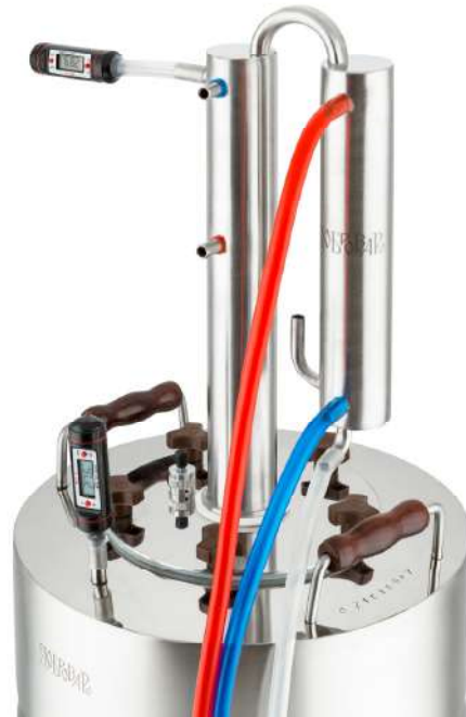
Рис. 2. Подключение аппарата в режиме дистилляции