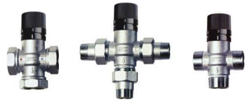
ART.3950 - ART.3956 - ART.3957