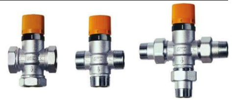
ART.3953 - ART.3954 - ART.3955