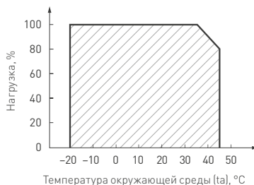
Рисунок 2. Максимальная допустимая нагрузка, % от мощности источника