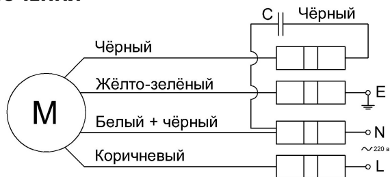
Рис. 3 – Схема подключения