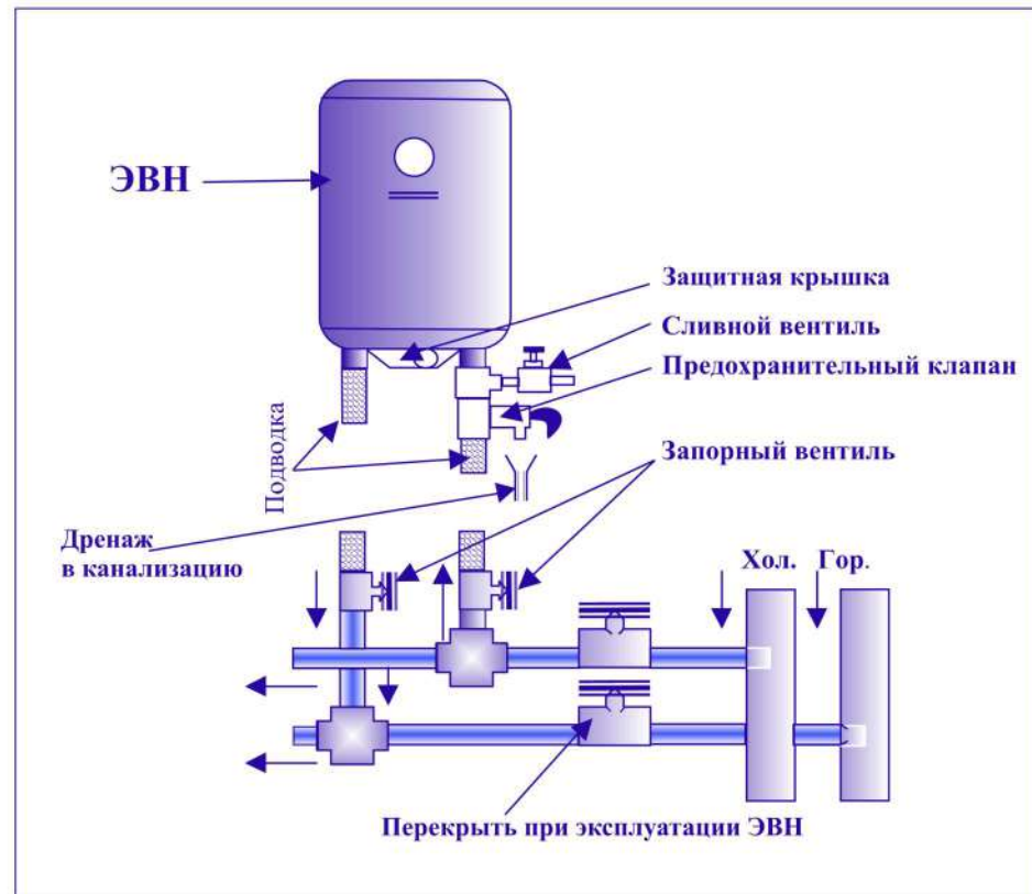
Рис. 1. Схема подключения ЭВН к водопроводу

При проведении технического обслуживания ЭВН силами специализированной организации в гарантийном талоне должна быть сделана соответствующая отметка. При замене магниевого анода потребителем самостоятельно к настоящему руководству на ЭВН должен быть приложен товарный чек на покупку магниевого анода.